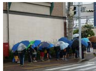
(雨の日の登校風景)