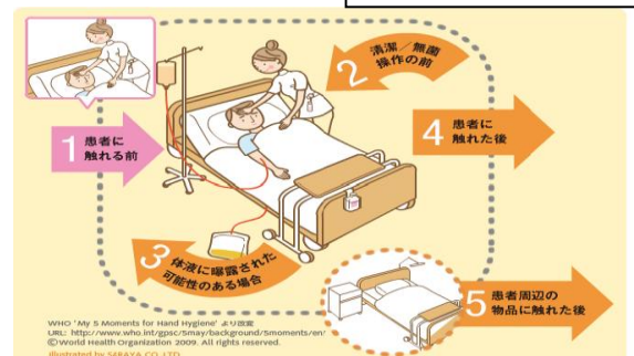
WHOの5つの手指衛生のタイミング