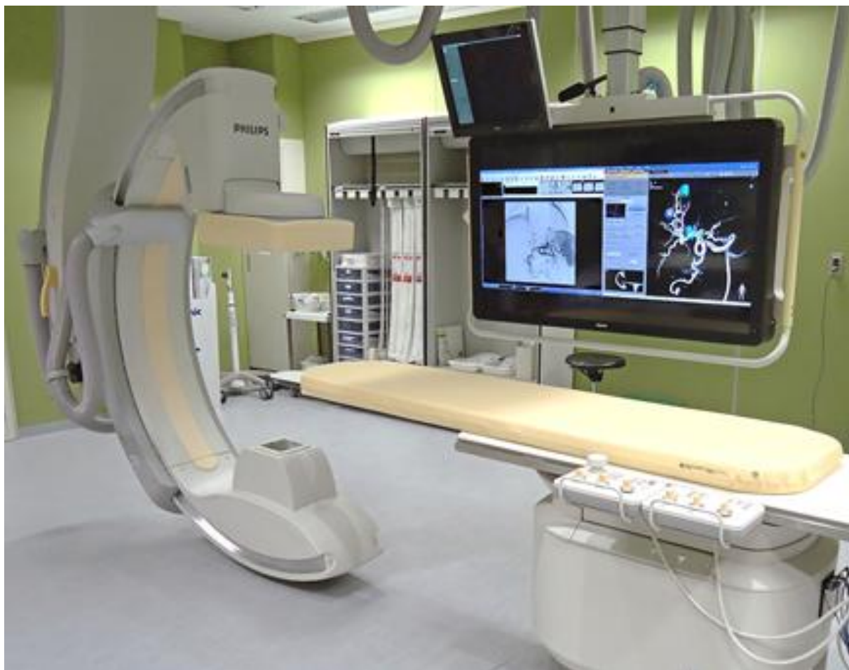
〈Allura Clarity FD20 と大画面マルチモニター Flex Vision XL〉