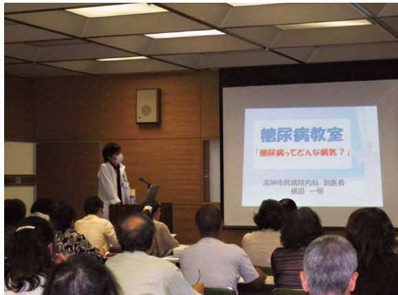
「糖尿病教室」の様子