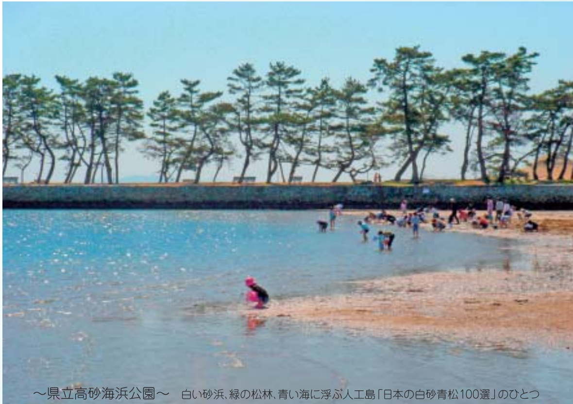
～県立高砂海浜公園～ 白い砂浜、緑の松林、青い海に浮かぶ人工島「日本の白砂青松100選」のひとつ