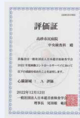
コントロールサーベイ 評価表(心臓領域)