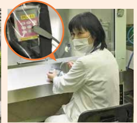
お薬をポンプに準備する薬剤師さん。